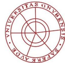
Universidad de Huelva