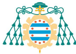
Universidad de Oviedo Universidá d'Uviéu University of Oviedo